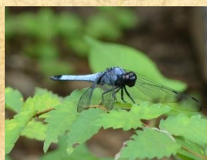
オオシオカラトンボ