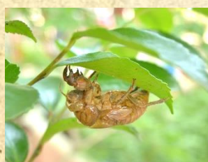
アブラゼミ (羽化殻)