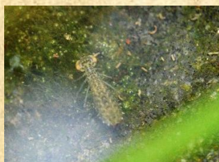
クロスジギンヤンマ (幼虫)