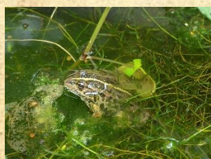
トウキョウダルマガエル