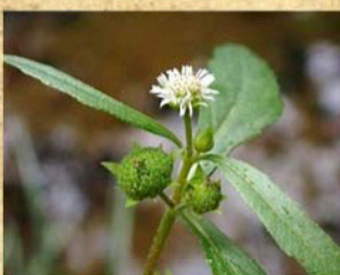
アメリカタカサブロウ

重点対策外来種の水草、オオカナダモが池の中で確認されました。5月にも見つけて駆除していましたが、そのときに根が少し残ってしまい、そこから再生したようです。また、アメリカタカサブロウは土の中に種が入っていたと考えられます。どちらも外国から日本に持ち込まれた外来種なので、龍神池で増えてしまわないように見守っていく必要があります。