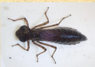
クロスジギンヤンマ (幼虫)