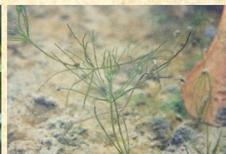
シャジクモ 希少性：環境省レッドリスト 絶滅危惧II類 (VU)