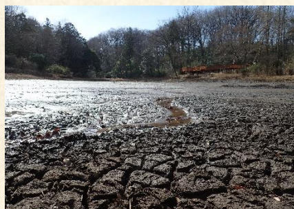
▲天日干しの様子 (都立狭山公園 宅部池)