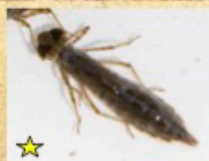
★ クロスジギンヤンマ (幼虫)