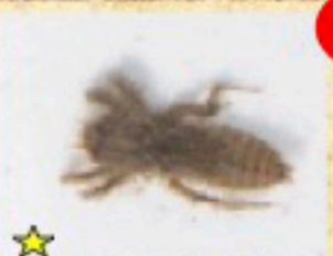
★ シオカラトンボ (幼虫)