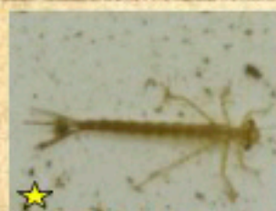
★ クロイトトンボ (幼虫)