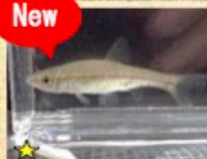
★ モツゴ (クチボン)